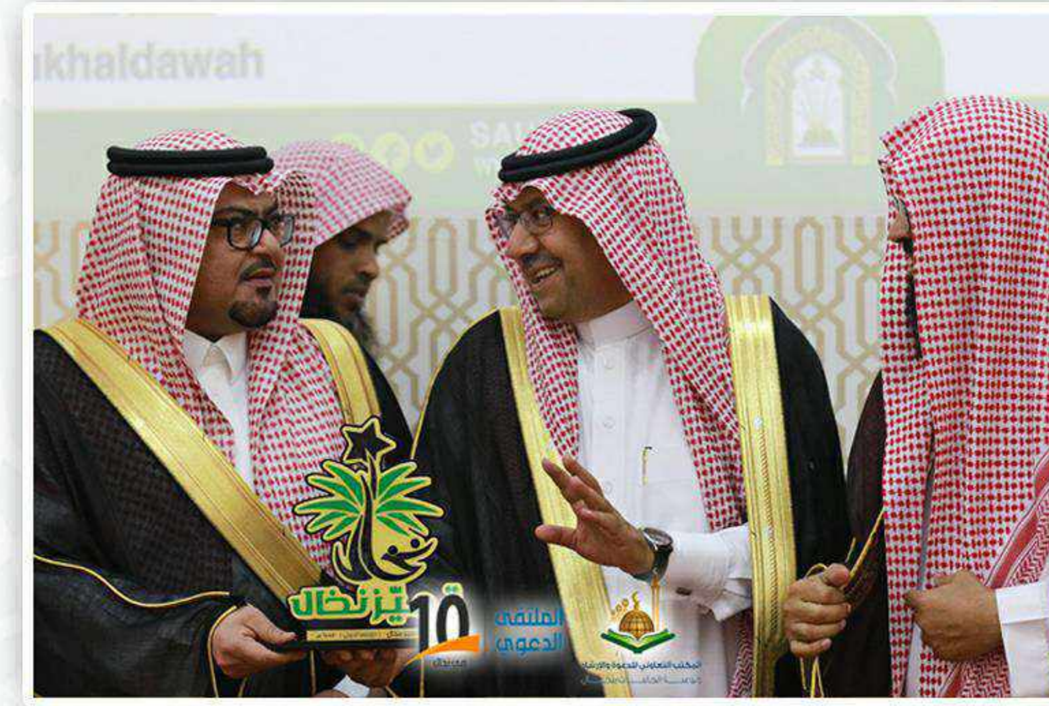
مدير الإدارة المتميز