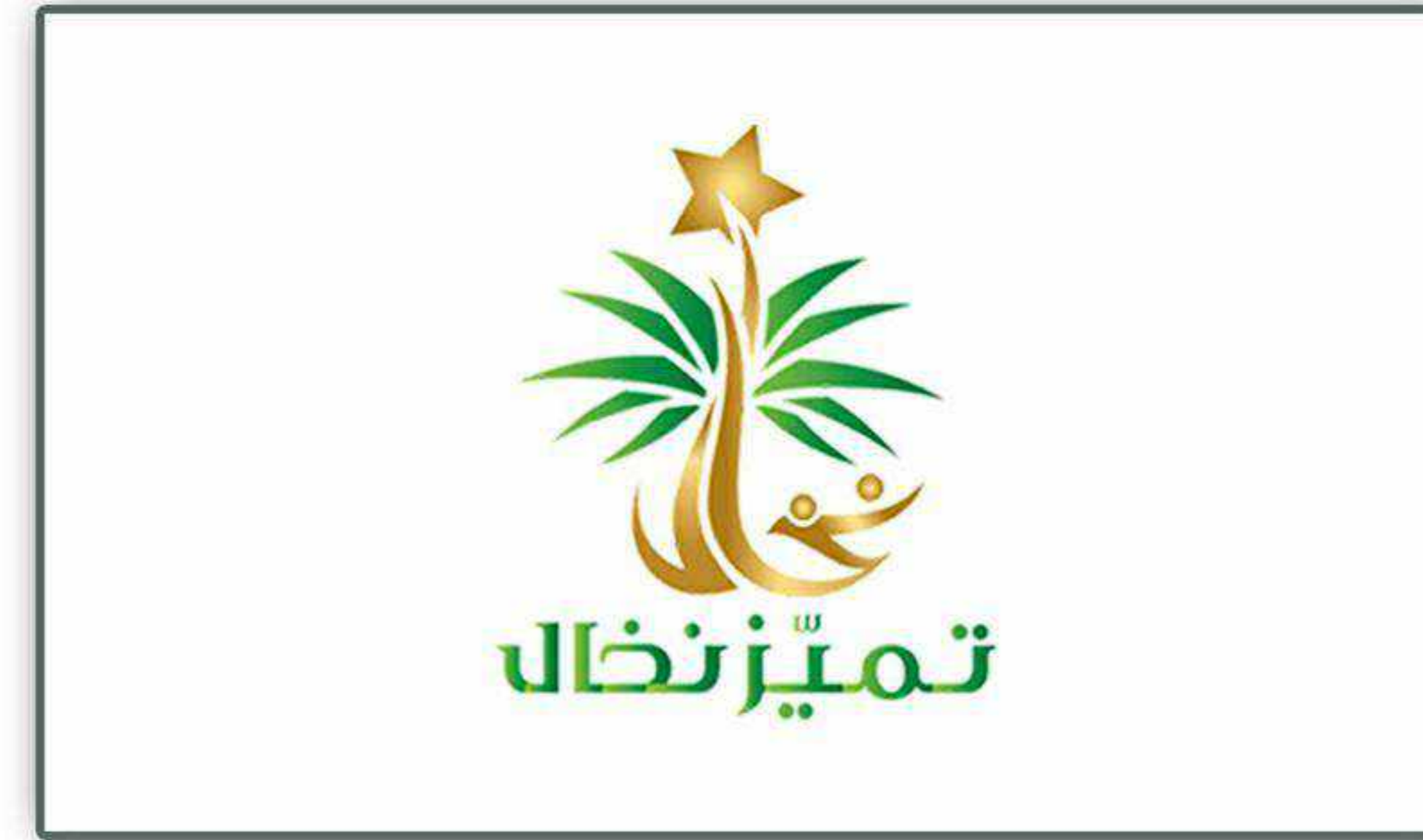
جائزة نخال للتميز في دورتها الثانية للعام ١٤٤١هـ