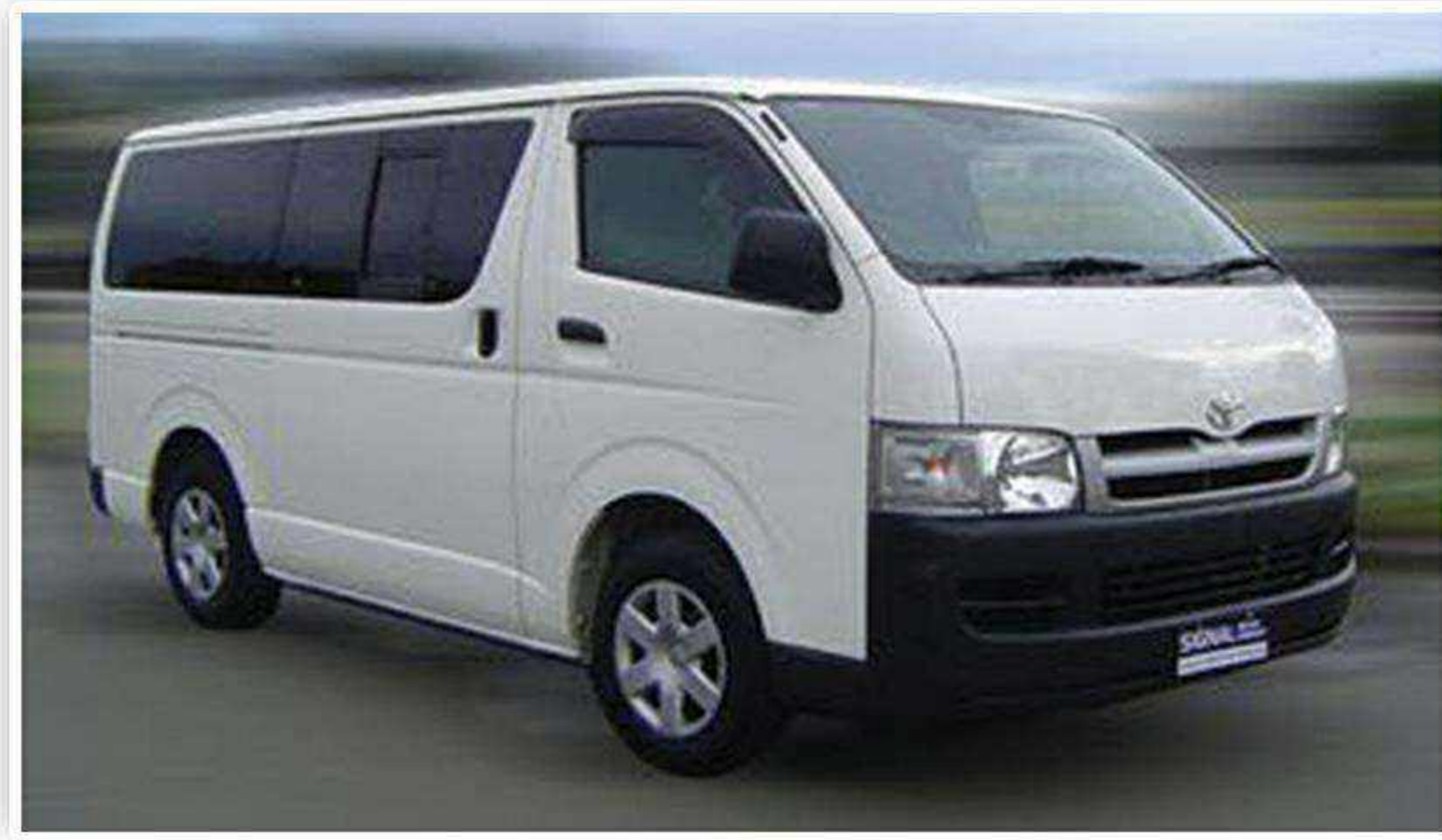
ميكروباص صغير ١٦ راكب