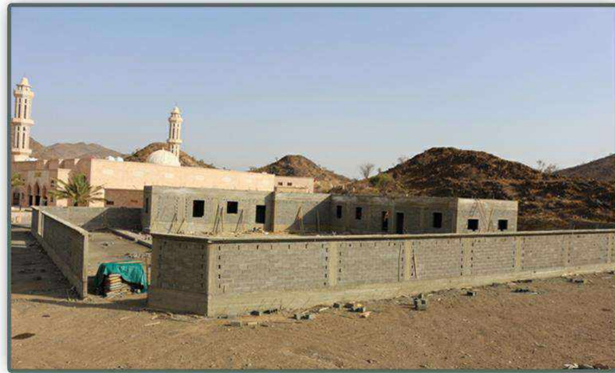
مشروع وقف شباب نشأ في طاعة الله