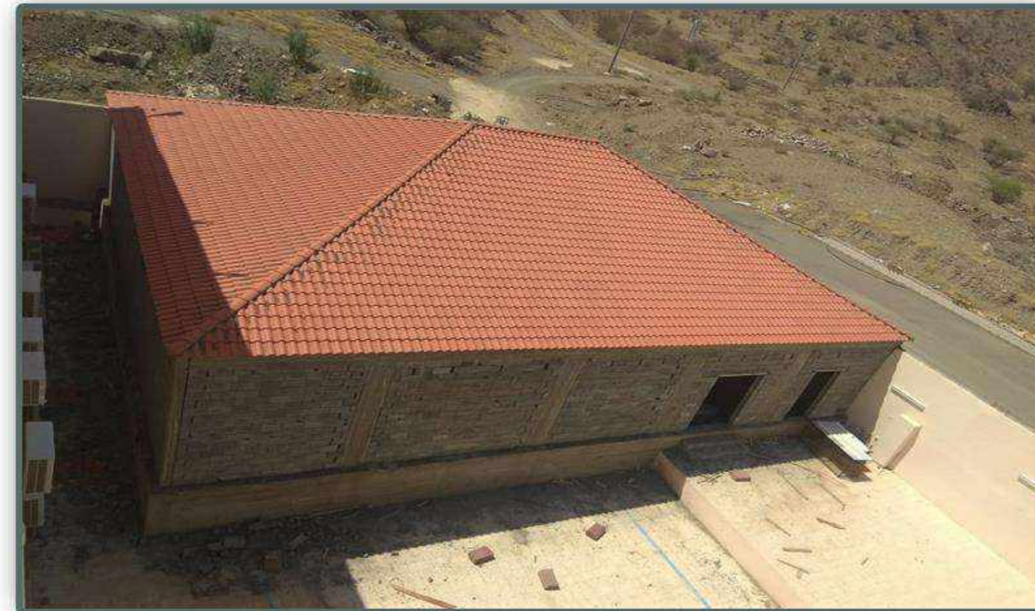
مشروع قاعة أمهات المؤمنين النسائية