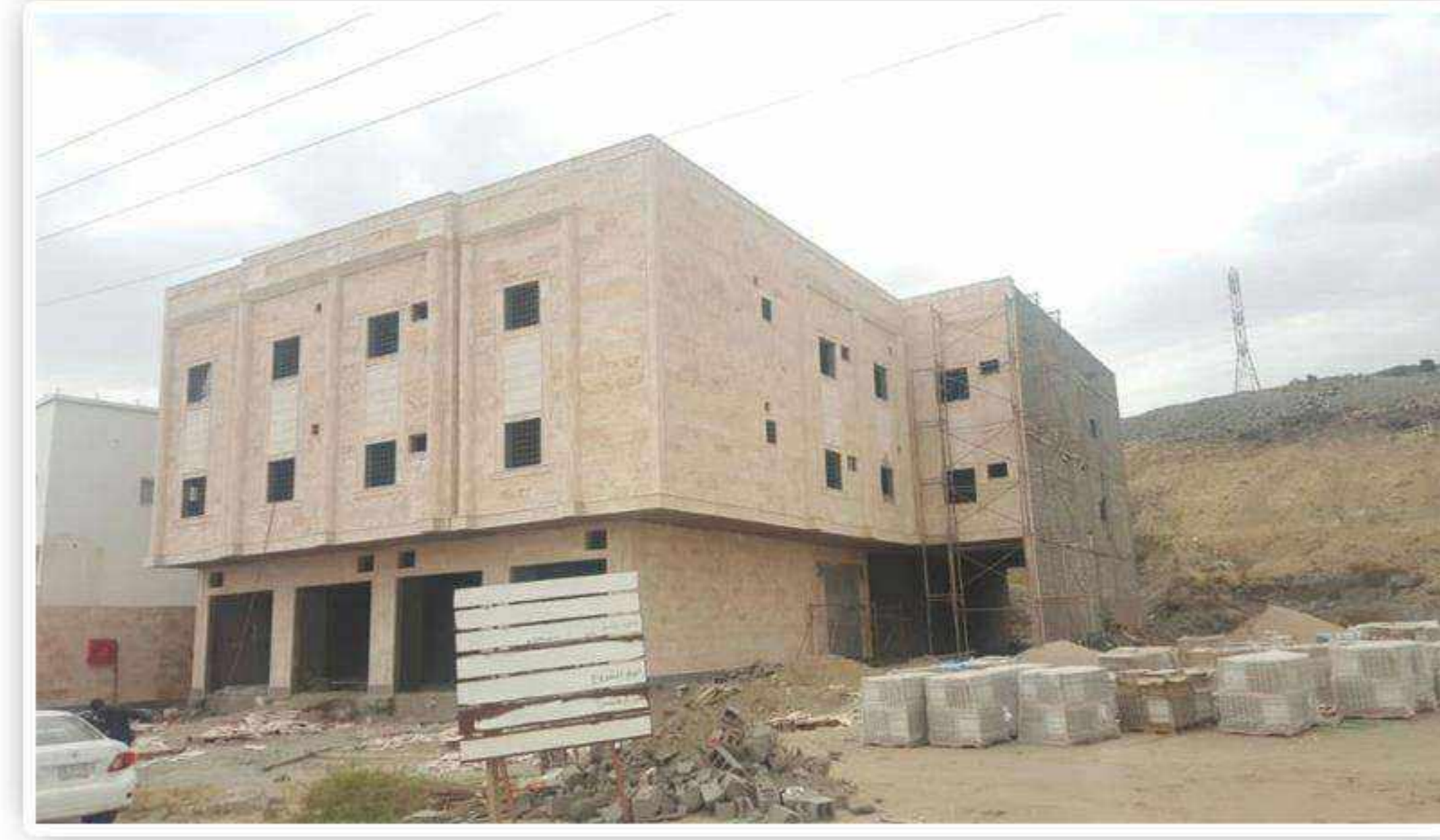
تشطيب وقف الأبرار الدعوي