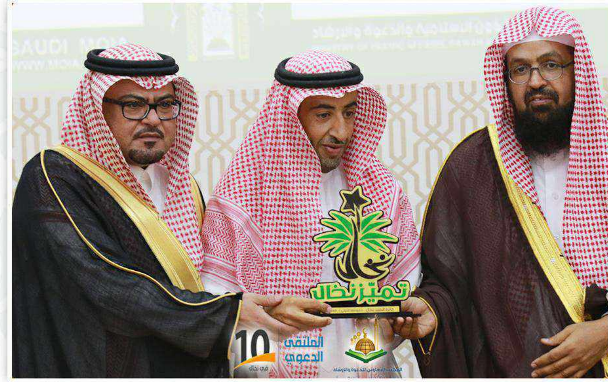
الراعي الرسمي للجائزة الاستاذ علي الصعيري